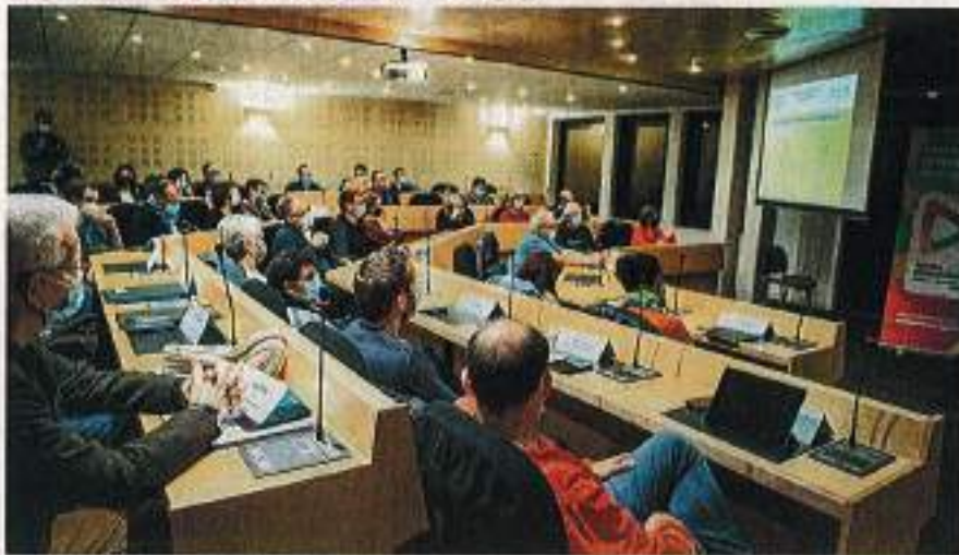
Les 64 membres du Conseil de développement se sont réunis pour la première fois mardi 25 janvier, dans l'auditorium de Mont-de-Marsan Agglomération.